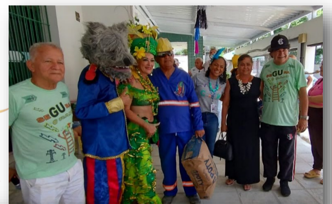
AAC-PE na Aposchesf

os associados e suas fantasias carnavalescas que por sinal deram um show de beleza e irreverência. O nosso muito obrigado às Associações da Compensa e da Chesf pelo convite.