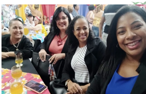
AAC-PE na Aposcompesa

A AAC-PE nos últimos dias 15 e 16 de fevereiro, foi convidada pelas Associações dos Aposentados da Compesa e da Chesf para participar das festividades de carnaval, presenciando a alegria dos seus associados e convidados. Tudo estava lindo e bem organizado, e para a nossa surpresa, a Associação foi convidada para ser jurada nos dois eventos para o concurso de melhor fantasia. Ficamos extremamente lisonjeados e agradecidos em poder prestigiar