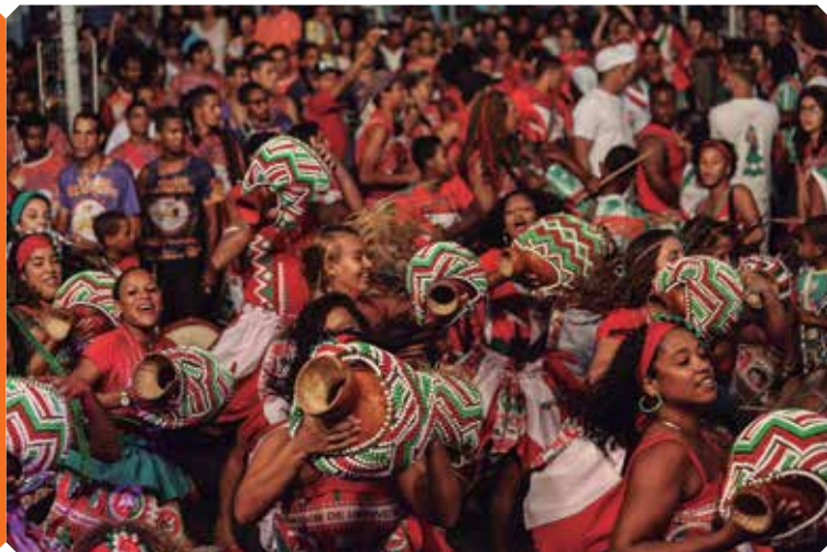
Ensaio de Maracatu