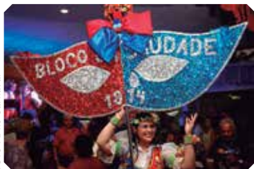
FOTO PE no Carnaval

Quem irá abrir o baile será Almir Rouche, que além de ser um ícone importante para Pernambuco, que também é um dos homenageados do Carnaval do Recife 2017. Junto com Almir, Otto, Maestro Spok e Fafá de Belém prometem trazer muita cor e frevo para a festa.