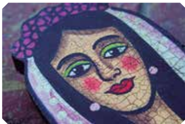
Detalhes da sua obra