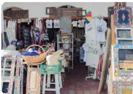
Lojinha no Mercado da Ribeira