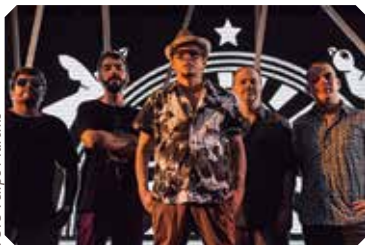
Mundo Livre S.A.